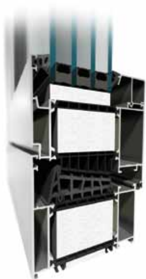
MB-104 Passive Aero